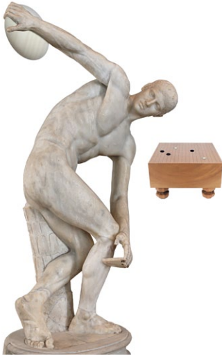
Le disgobole ou l'invention du pétanque-go par les Grecs