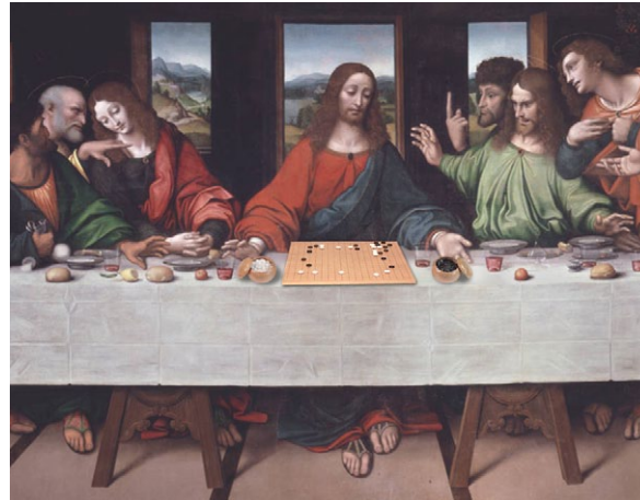
Scène de kibitz - Giampietrino