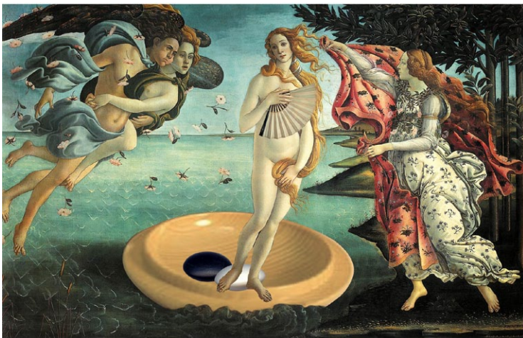
La naissance de la joueuse en dan - Sandro Botticelli