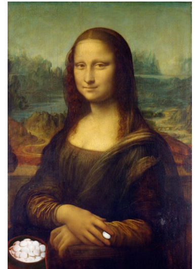
Pourquoi le sourire de la Joconde ? Elle a lu le tesuji !