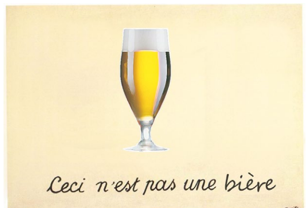
Ceci n'est pas une bière - René Magritte